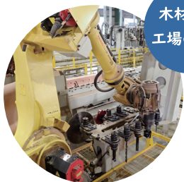
木材加工 工場の見学

広大なストックヤードに、豊富な木材のストック！「てまひま」かけた木材生産の過程をお話しします。