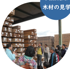
天然乾燥 木材の見学